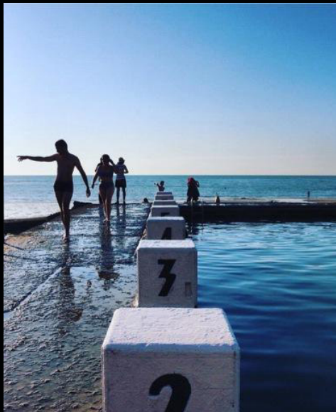
Delphine Barré ©

DU 22 SEPTEMBRE AU 30 NOVEMBRE Exposition "Plages & piscines" par Delphine Barré La maison d' à côté 7a rue de Blainville 50230 Agon-Coutainville