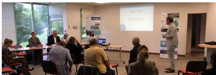
Rencontre communale PLUi – Gavray – 15 / 09 / 2021

Vous souhaitez suivre le projet ? Rendez-vous sur le site internet www.coutancesmeretbocage.fr , rubrique « grand dossier urbanisme ». Pour recueillir les observations des habitants et professionnels, des registres de concertation sont disponibles dans les mairies, au siège et au service urbanisme de Coutances mer et bocage.