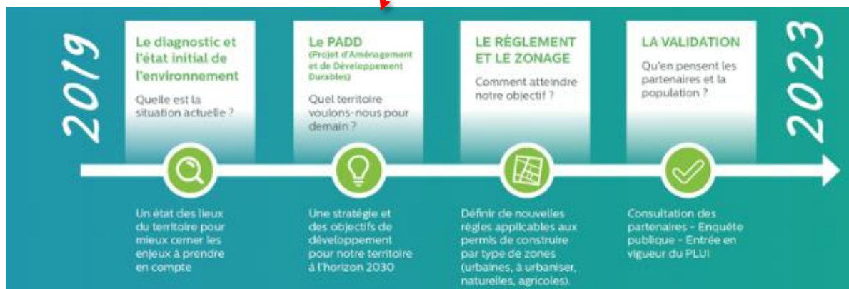
Les étapes du projet